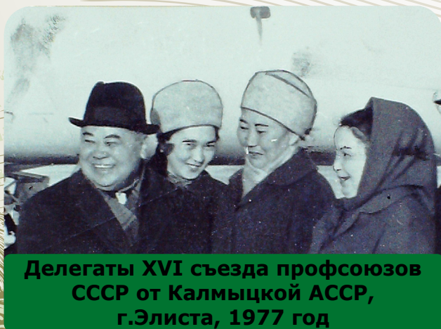
Делегаты XVI съезда профсоюзов СССР от Калмыцкой АССР, г.Элиста, 1977 год