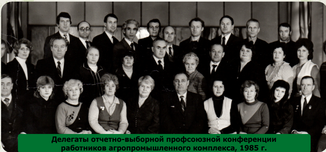
Делегаты отчетно-выборной профсоюзной конференции работников агропромышленного комплекса, 1985 г.

нов; совершенствование организационно-массовой работы, вовлечение тружеников совхозов и служащих МТС в члены Профсоюза; налаживание культурно-массового обслуживания сельского населения, работы сельских клубов, киноустановок, обустройство и оборудование красных уголков, библиотек, выступление агитбригад на животноводческих фермах и полевых станах.