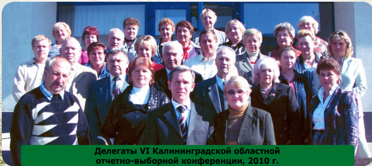
Делегаты VI Калининградской областной отчетно-выборной конференции, 2010 г.

Серьезным испытанием для профсоюзных организаций стали 90-е годы, когда аграрный комплекс экономики, как впрочем и вся экономика страны, понесли невосполнимые потери. Преднамеренные, преступные действия органов государственной власти, и в первую очередь центра, по реформирова-