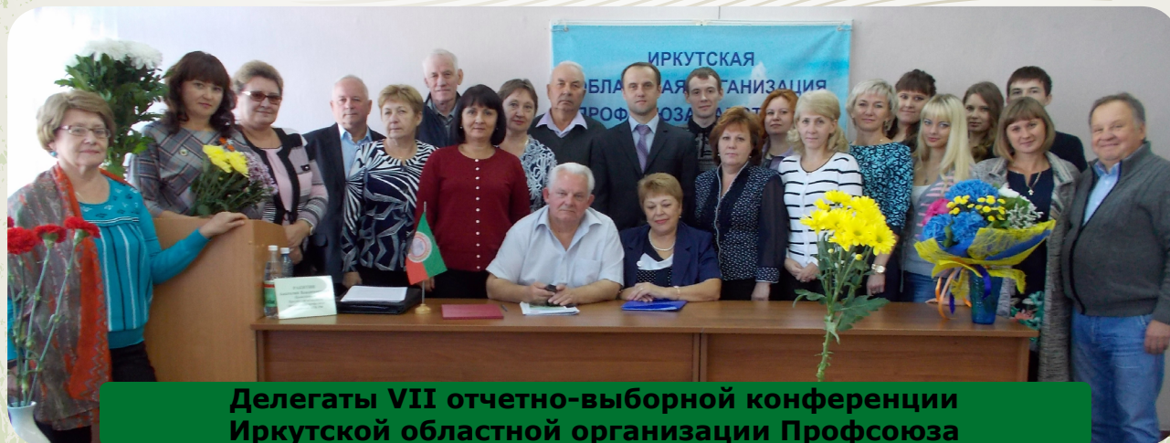
Делегаты VII отчетно-выборной конференции Иркутской областной организации Профсоюза